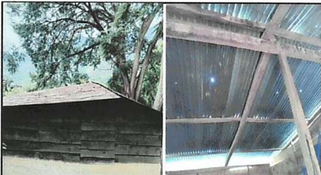
FOTO 4: EL TECHO DE LA COCINA Y SANITARIO SE ENCUENTRAN OXIDADOS Y PICADOS, ASÍ COMO LA ESTRUCTURA PORTANTE DE MADERA YA ESTA PODRIDA REQUIRIENDO EL CAMBIO DE ELLOS