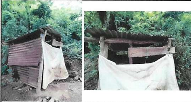
FOTO 1: EL SERVICIO SANITARIO ESTÁ EN SITUACIONES DEPLORABLES E INSALUBRES, Y UNA SOLA TAZA PARA AMBOS SEXOS, ESPERANDO CON EL PROYECTO 2 SANITARIOS MEJORES CONDICIONES SANITARIAS