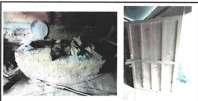
FOTO 6: EL POLLETÓN, PUERTAS Y VENTANAS DE COCINA Y SANITARIOS ESTÁN EN MAL ESTADO, ESPERANDO CON EL REMOZAMIENTO ALCANZAR LAS MEJORAS PARA AMBOS AMBIENTES

Observación: Si es necesario se pueden agregar hojas adicionales y actualizar el número de hojas.