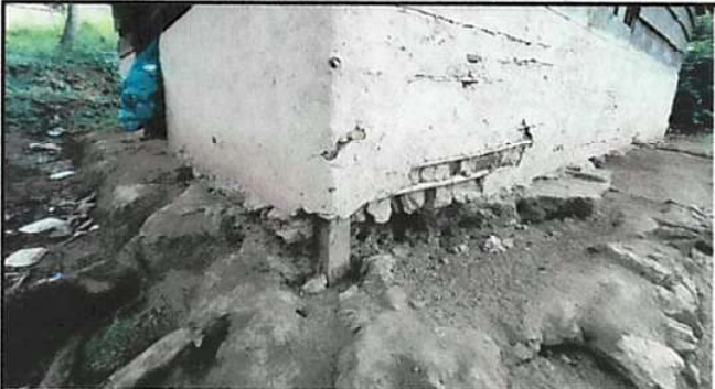
FOTO 3: LAS PAREDES DE LA COCINA SE ENCUENTRAN DETERIORADAS POR LO QUE SERÍA CONVENIENTE REALIZAR LA REPOSICIÓN DE ESTAS PAREDES DE COCINA Y EN SANITARIOS